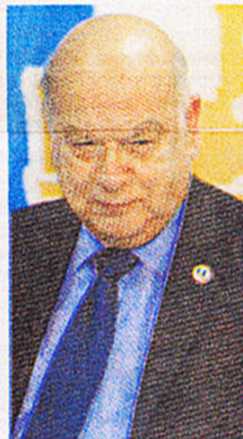
José Miguel Insulza