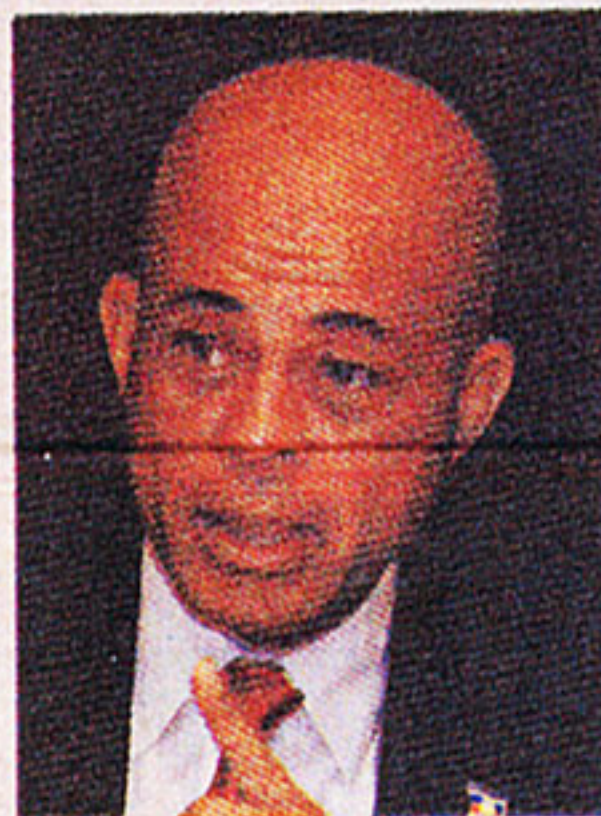
Diplomacia. El 22 de noviembre, los gobiernos dominicano y haitiano firmaron un acuerdo que daba prioridad al diálogo en el tema de la sentencia 168/13 del TC.